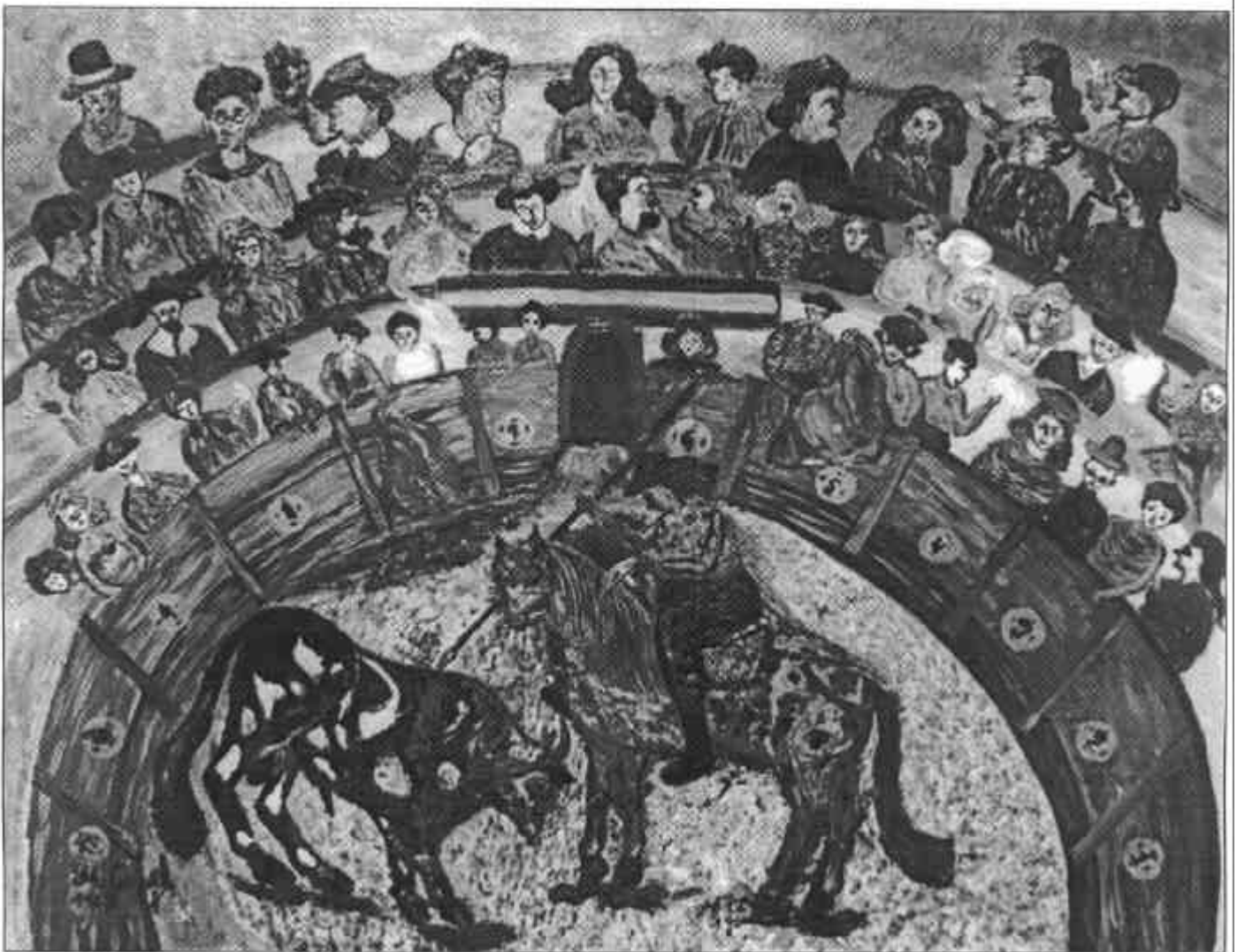
Corrida de toros