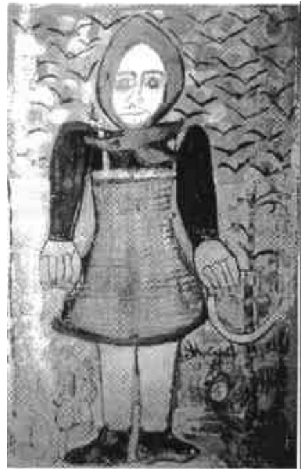
Imagen pintada en una pared de su casa en Góchar